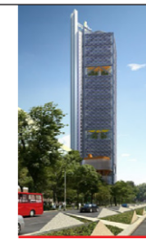
Torre BBVA Bancomer Reforma 506