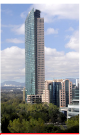
Torre Mayor Reforma 505