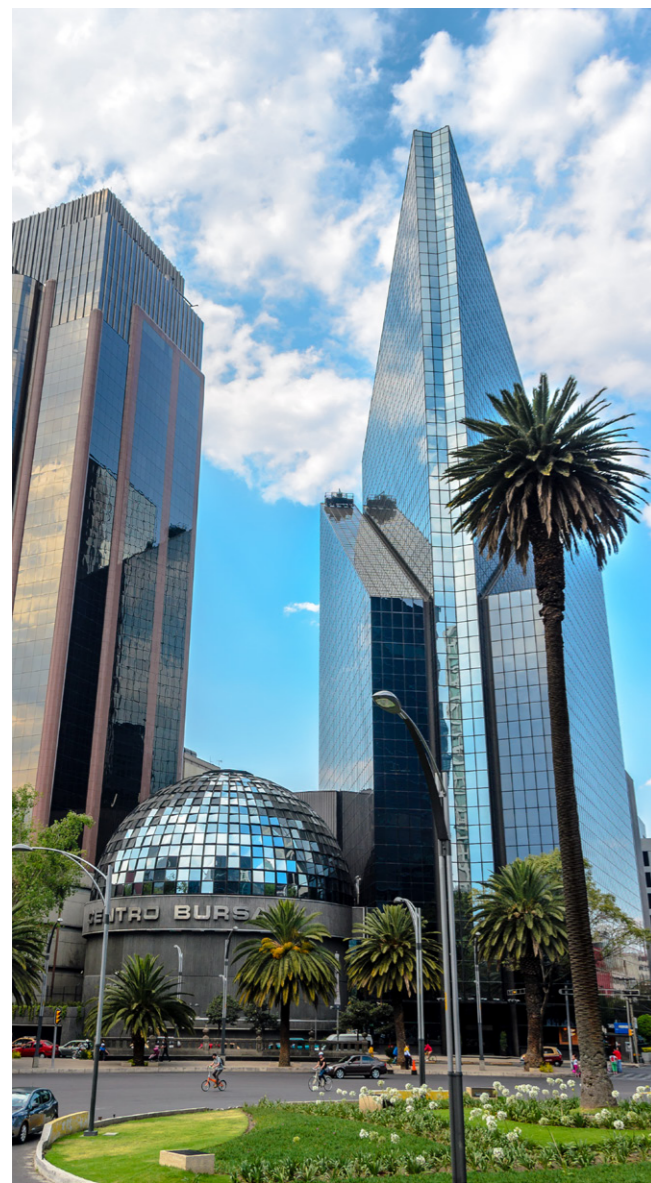
La capital financiera en México no es la misma y cambia constantemente.