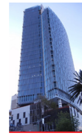
Torre New York Life Reforma 342